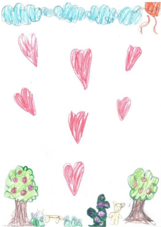
Lainy Rhiane Miranda Diniz 5° ano