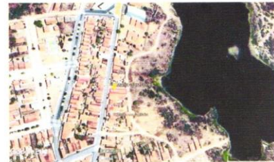
Figura 1 - Imagem de satélite

Destaca-se que a referida conferência mecânica de limites foi expressa através da elaboração de Planta de Situação do lote. Tais projetos foram realizados a fim de DELIMITAÇÃO DE ÁREA e DESAPROPRIAÇÃO do objeto acima citado.