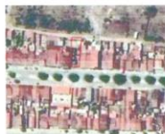
Figura 1 - Vista aérea do lote

Gabinete do Prefeito Constitucional do Município de Algodão de Jandaíra, 15 de Dezembro de 2023.